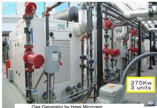
375Kw 3 units