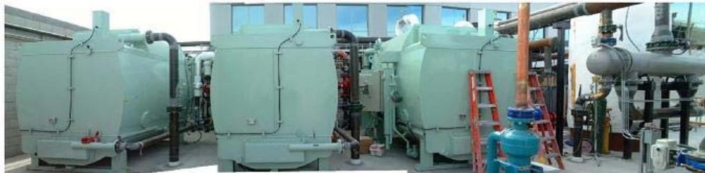
Adsorptionchiller NADAC-120 * 3units

chilled water inlet Temp. 50.3° F = 10.2 ° C chilled water outlet Temp. 43.3° F = 6.3 ° C Ref Temp. 43.2° F = 6.3 ° C