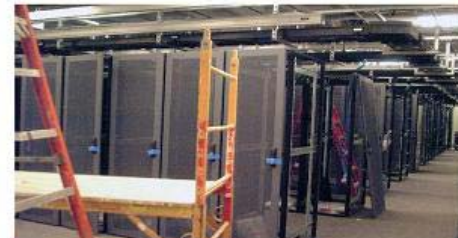
HEX for Hot water