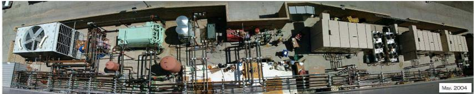
The Adsorption chiller installed in Fresno Federal Guarantee Saving Build. ( Fresno City, CA . USA )