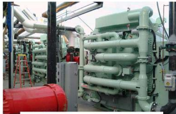
Adsorptionchiller NADAC-120 * 3 units