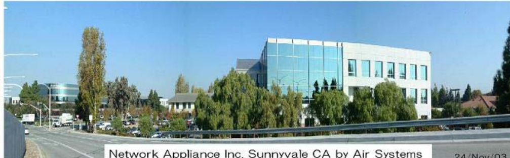
Network Appliance Inc. Sunnyvale CA by Air Systems